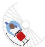
Escalier en colimaçon