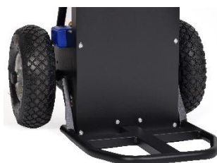
Bavette livrée en série, repliable. Dimensions : 310 x 270 mm. Poids : 2 kg.

Interrupteur pour un fonctionnement en continu ou une marche à la fois : - Mode ALTERNATIF : marche par marche. - Mode CONTINU : enchainement de la montée des marches.