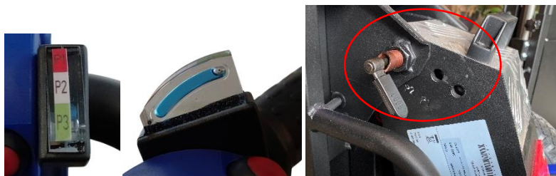
3 positions de réglage du moteur