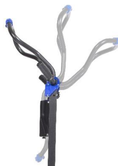
Poignée réglable sur plusieurs positions.