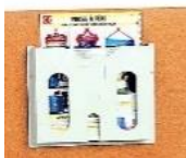
802 000 001 Porte document plastique autocollant