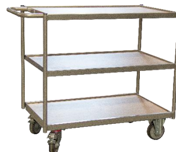
Desserte CU 250 kg