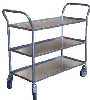
Desserte plateaux tôle CU 200 kg