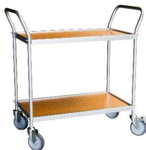
Desserte plateaux mélaminé CU 150 kg