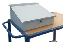
882 006 039 Pupitre à poser avec écritoire verrouillable 440 x 520 mm.