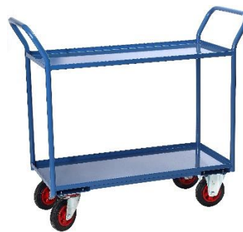
Servantes plateaux tôle CU 400 kg