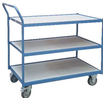
Servantes plateaux mélaminé CU 250 kg