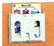
802 000 001 Porte document plastique autocollant