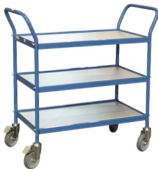
Servantes plateaux mélaminé CU 150 kg