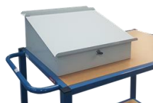
882 006 039 Pupitre à poser avec écrioire verrouillable 440 x 520 mm.