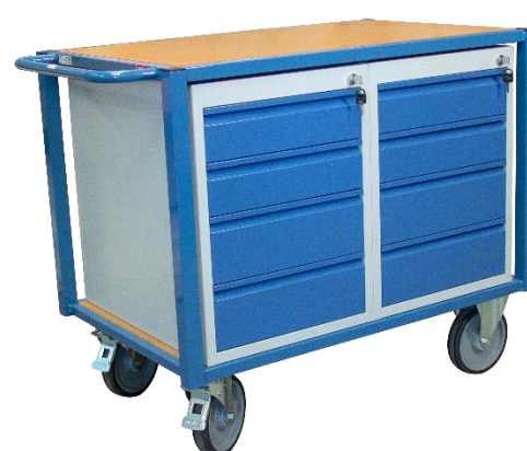
880 002 990 – 2 blocs tiroirs