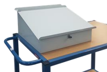
882 006 039 Pupitre à poser avec écrivain verrouillable 440 x 520 mm.