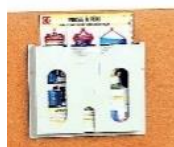
802 000 001 Porte document plastique autocollant