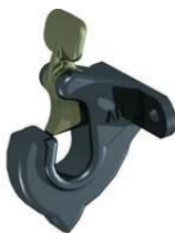
872 000 412 Pour remorques CU 2T et 3T

1 crochet arrière pour mise en train simple. Pas de possibilité d'inversion du sens de traction.