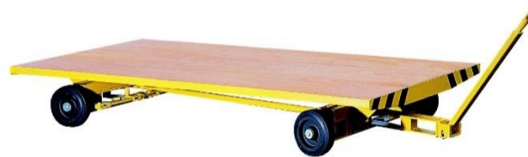
Sur fusées articulées - 2 essieux directeurs