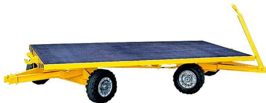
Sur couronnes à billes - 2 essieux directeurs