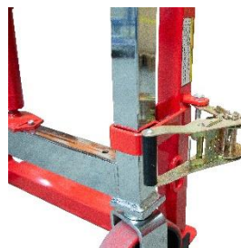
Tendeur à cliquet