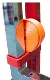
Sangle de maintien