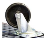
NY - Roues nylon CU 350 kg - Bandage dur pour sols lisses