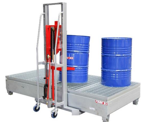
2 transicuves / 8 fûts