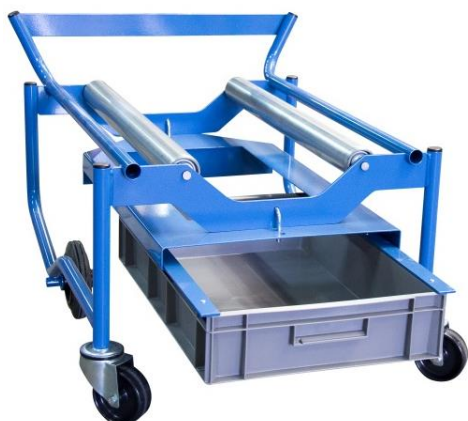
842 007 603 Bac plastique de soutirage 20 L coulissant Fixé au châssis métallique, il coulisse comme un tiroir en fonction des besoins de l'opérateur. Dimensions : 800 x 430 x 135 mm. Poids : 9 kg