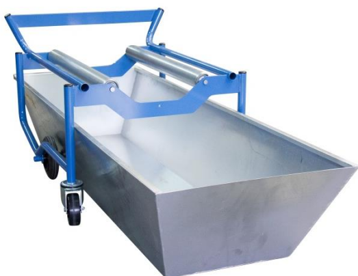
845 007 602 Bac de rétention en acier galvanisé 220 L Il peut se positionner sous le chantier à fût afin d'éviter tout risque de pollution. Dimensions : 1680 x 554 x 303 mm. Poids : 20 kg