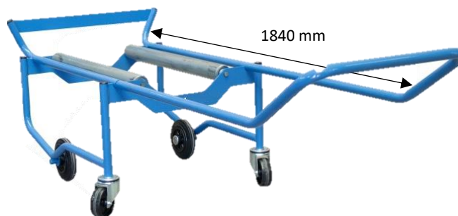
Modèle équipé d'un dossier amovible