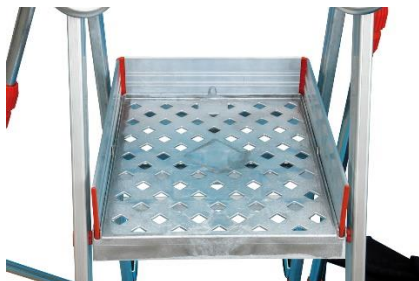
Plateforme supérieure de 405 x 510 mm