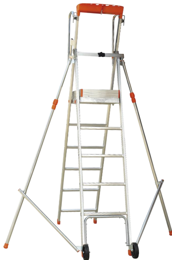
835 007 673 – 6 marches