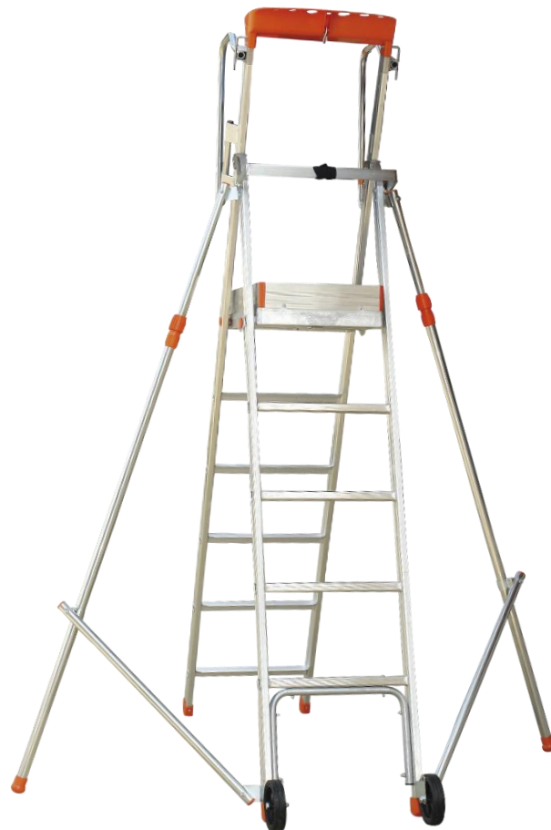
835 007 673 – 6 marches