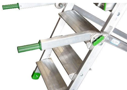
Poignées de manutention repliables