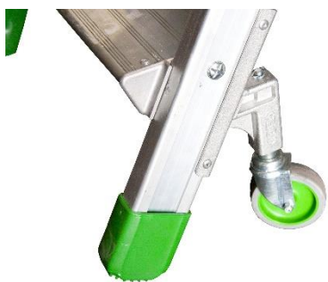
Système d'immobilisation automatique