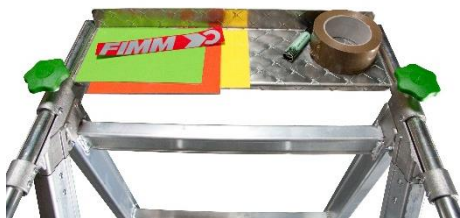
Tablette porte-outils démontable