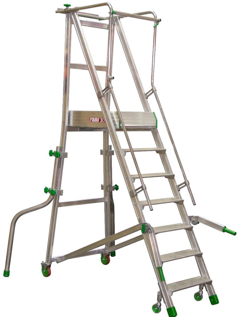
835 007 657 – 7 marches