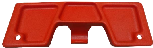
Large porte outils en nylon