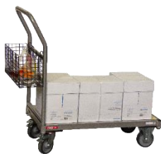
802 000 002 Panier à fil 500 x 150 x 200 mm