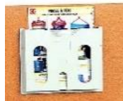
802 000 001 Porte document plastique autocollant