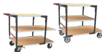
Différentes combinaisons de plateaux