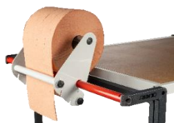
Dévidoir 882 006 152 Pour rouleaux Ø 300 mm maxi.