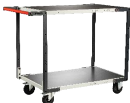
Plateau tôle galva