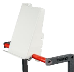
Porte-documents format portrait A4 882 006 150