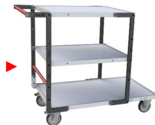
Barre de maintien Évite la chute d'objets Plateaux taille XS et S : 802 000 017 Plateaux taille M : 802 000 018