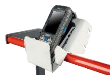
Porte-douchette 882 006 149