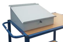
882 006 039 Pupitre à poser avec écritoire verrouillable 440 x 520 mm.