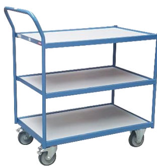
Servante 1 poignée horizontale Capacité 250 kg