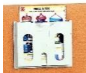
802 000 001 Porte document plastique autocollant