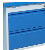
882 006 038 2 tiroirs sur plateau 1000 x 600 mm. Dimensions 460 x 600 x 380 mm. Livré monté.