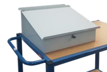
882 006 039 Pupitre à poser avec écrioire verrouillable 440 x 520 mm.