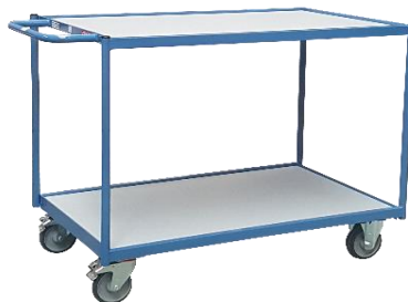
Servante 1 poignée horizontale CU 250 kg