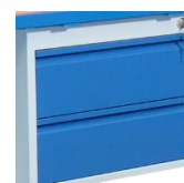
882 006 038 2 tiroirs sur plateau 1000 x 600 mm. Dimensions 460 x 600 x 380 mm. Livré monté.