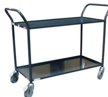
Servante plateaux tôle CU 200 kg