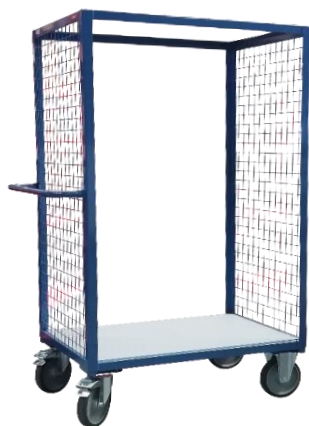
Grillagée 2 côtés