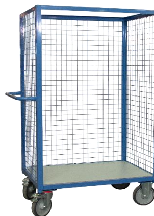
Grillagée 3 côtés