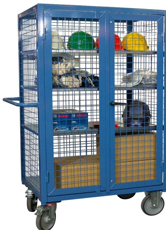
880 005 308 avec 3 options étagères

Servante verrouillable par une poignée équipée d'une serrure - 1 clé fournie