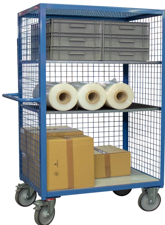
880 005 306 avec 2 options étagères