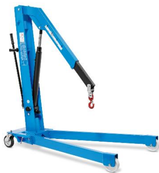
Forme V, pliante