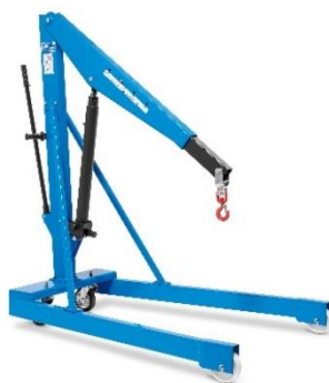
Forme V, fixe