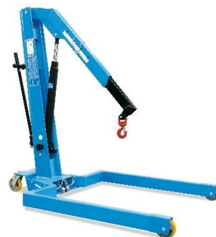
Forme U, pliante