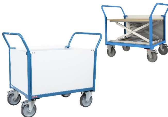
Chariot à niveau constant avec habillage PVC personnalisable