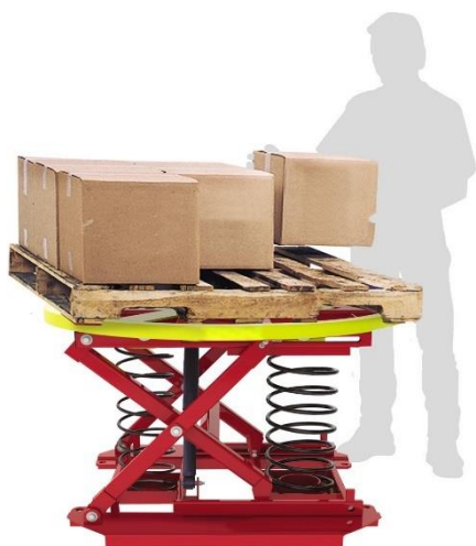
Table élévatrice à niveau constant fixe avec plateau tournant