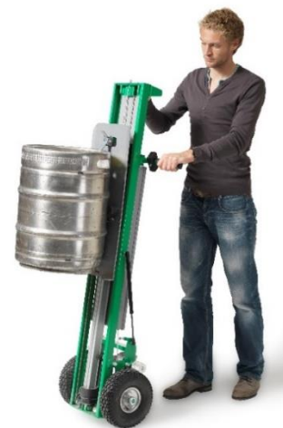
Kit gerbeur + accessoire pour fûts