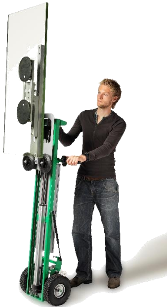
Kit gerbeur + ventouse