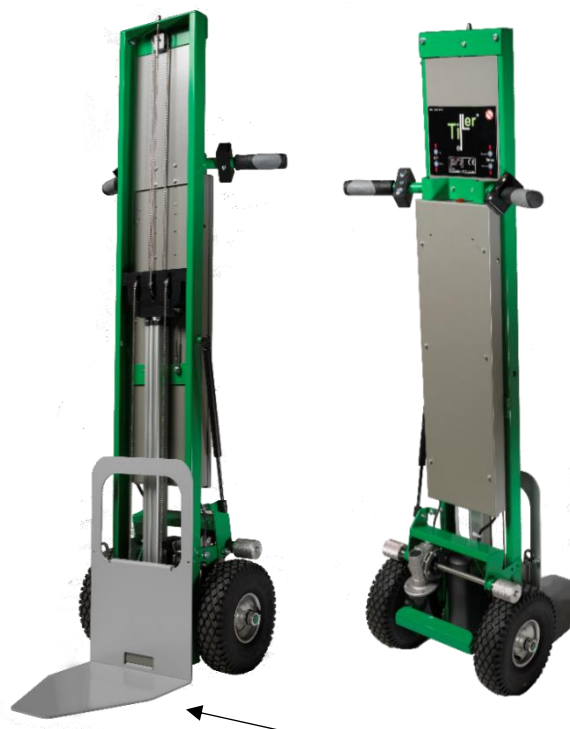
Bavette livrée en série