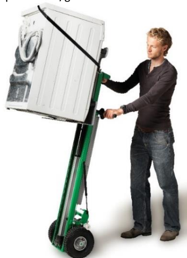
Kit gerbeur + accessoire électroménager