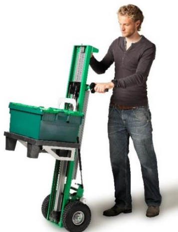
Kit gerbeur + accessoire pour ¼ de palette