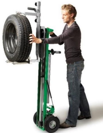
Kit gerbeur + accessoire pour roues/grandes roues