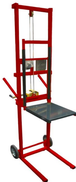
Modèle CU 100-150 kg

Levée 1750 mm et CU 100 kg avec rallonge déployée