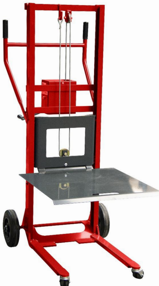
855 000 650 avec option 855 006 152