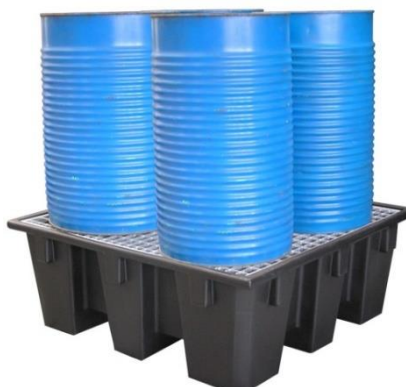
845 009 505 4 fûts, caillebotis acier galvanisé