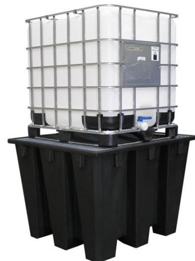
845 009 506 1 transcuve, caillebotis acier galvanisé