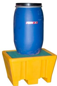
Bac avec caillebotis en PEHD capacité 225 L