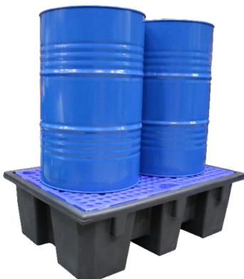
845 006 655 2 fûts, caillebotis PEHD