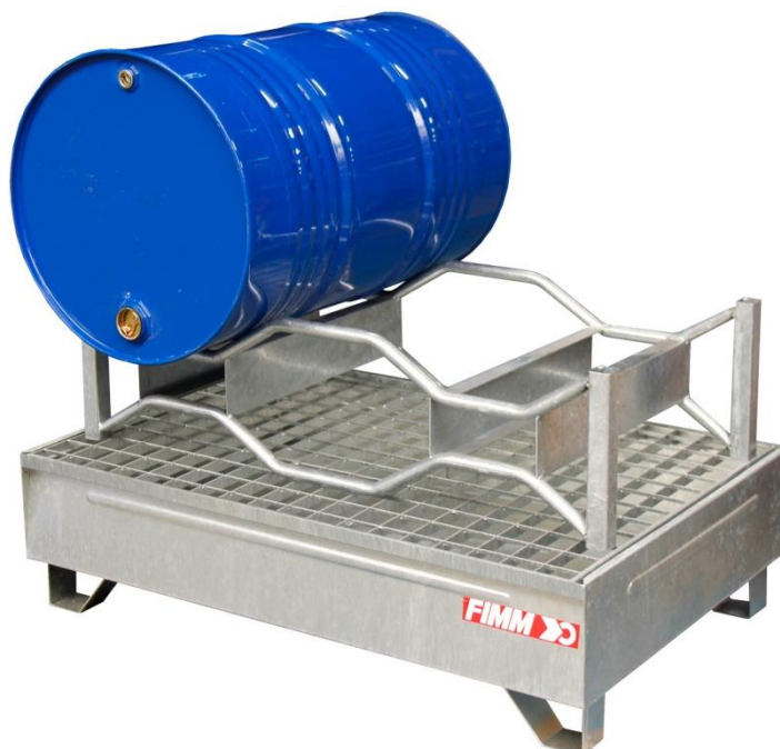
845 006 628 + 840 008 155 support de stockage