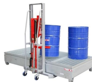
2 transicuves / 8 fûts