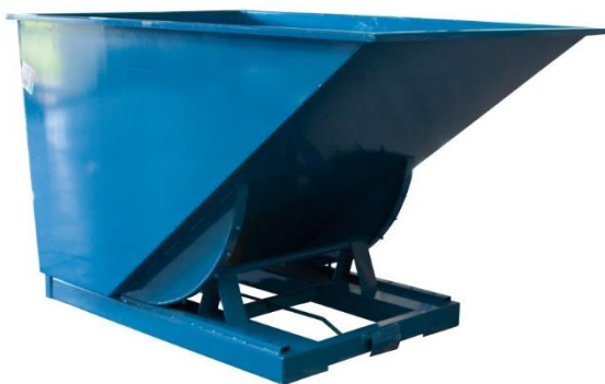
Bennes d'atelier auto-basculantes, de 150 à 3000 L.