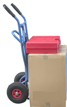
Position 1 Diable tablier droit