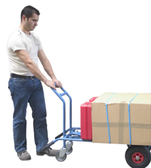
Position 3 Version chariot CU 350 kg Roulettes pivotantes à l'arrière