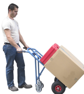
Position 2 Tablier incliné pour un bon maintien de la charge, béquille équipée de roulettes pivotantes Ø 125 mm pour une grande manoeuvrabilité