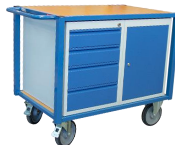
Servante CU 500 kg équipée 1 bloc tiroirs + 1 bloc porte