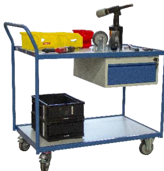
Poignée verticale, équipée 1 tiroir, CU 250 kg