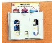
802 000 001 Porte document plastique autocollant