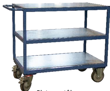
Plateaux tôle CU 400 kg