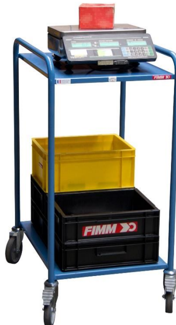
880 008 443 – 2 plateaux