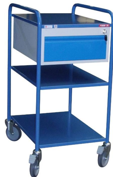
880 008 446 – 3 plateaux et 1 tiroir